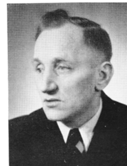
Bürgermeister Wilh. Schneider Eggerscheid