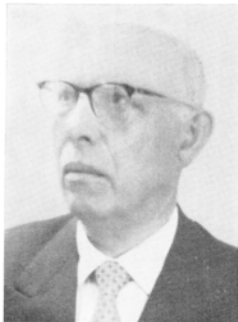
Bürgermeister Ludw. Dötsch Angermund