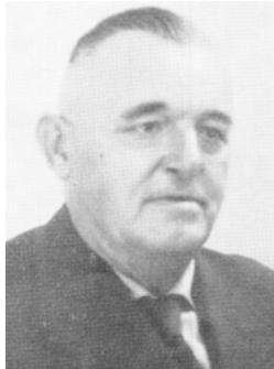
Bürgermeister Herm. Kockerscheid Lintorf