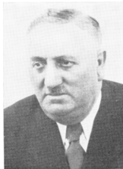
Bürgermeister Franz Rütjes Breitscheid